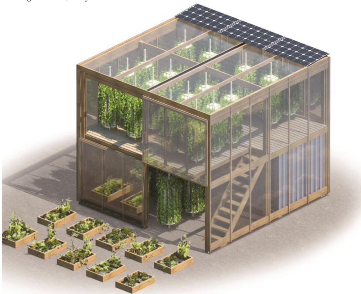
Hydroponisk bylandbrug. 6.000 kilo bladgrønt om året på 7*7 meter // Human Habitat