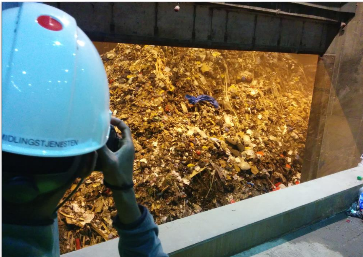
Vestforbrænding, 2015. Affaldet til afbrænding skinner som guld og har forblændet mange