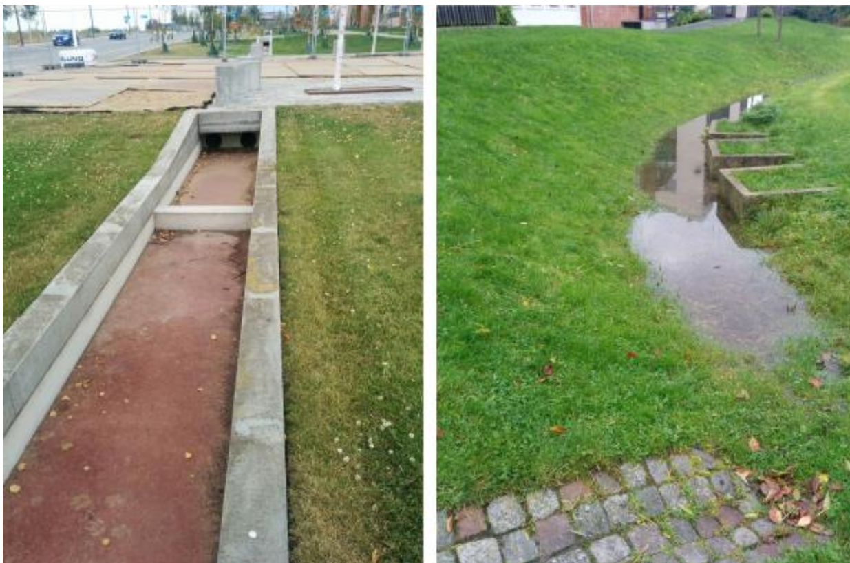
LAR-løsning i København 2015 sat over for Malmö-løsning fra 90'erne. Der er lang vej endnu // egne billeder